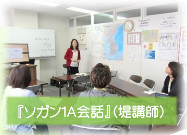
『ソガン1A会話』(堤講師)