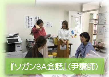
『ソガン3A会話』(尹講師)