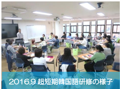
2016.9 超短期韓国語研修の様子